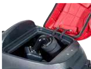
Fácil limpeza do depósito de recuperação de 73 l graças à sua grande abertura.