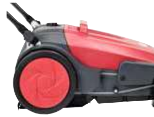
Rodas grandes que não deixam marcas.