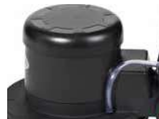
Motor silencioso e engrenagens.