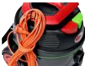
Suporte para fácil armazenamento do cabo.