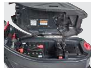
Depósito de recolha com pega para facilitar a sua inclinação.