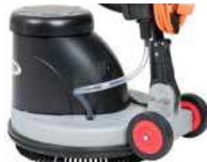
Potente, motor robusto e rodas traseiras grandes para facilitar o transporte.