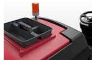
Fácil acesso à bandeja de resíduos