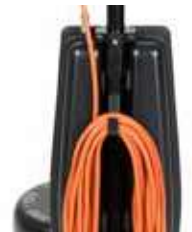
Gancho de metal robusto para enrolar o cabo e guardá-lo de forma segura.