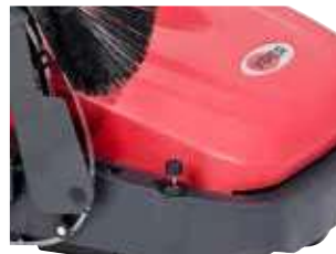
As escovas laterais podem ajustar-se individualmente apenas ao girar o manípulo.