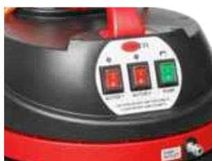
Função One-touch para uma operação fácil.