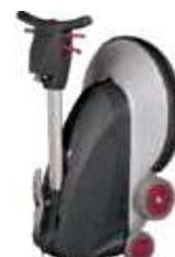
Possível de armazenar na vertical para poupar espaço. Rodas grandes para transporte fácil.