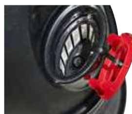
O enchimento de água é feito através de uma grande entrada de água com filtro e tampa protetora.