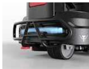
Para-choques resistentes com luzes de alta visibilidade