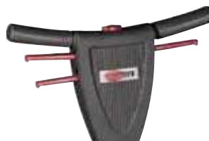
Pega ergonómica ajustável em altura, bloqueio de segurança e fácil de usar.