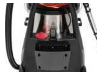
Depósito de água limpa integrado no chassis.