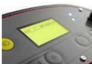
Ecrã LCD com contador de horas