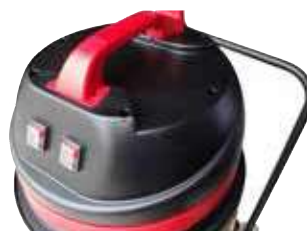
Fácil de usar graças à pega ergonômica com gancho para o cabo e dois botões independentes on/off.