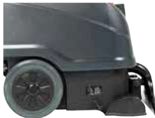
Rodas grandes para fácil transporte e melhor manobrabilidade.