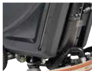
Indicador do nível de água com volume visível no depósito.