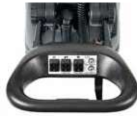
Pega ajustável e ergonómica.