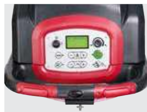
Painel de controlo intuitivo com ecrã LCD.