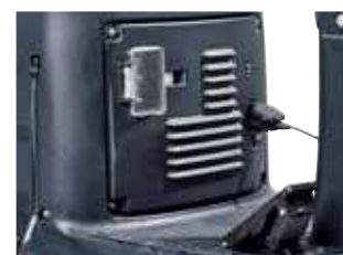
Um carregador a bordo integrado permite uma carga fácil da bateria em qualquer local.