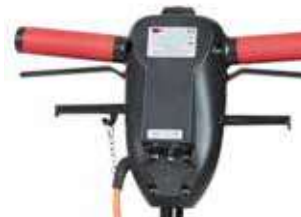
Pega ergonômica com ajuste da altura, bloqueio de segurança e manípulo para controlar o depósito de detergente.