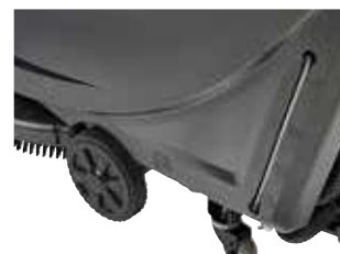
Fácil de manobrar e transportar: rodas grandes e fortes, para a máquina estar bem equilibrada.