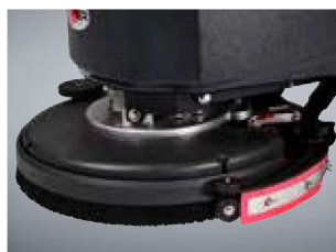
O bocal pode ser colocado e retirado sem necessidade de ferramentas, simplificando a manutenção