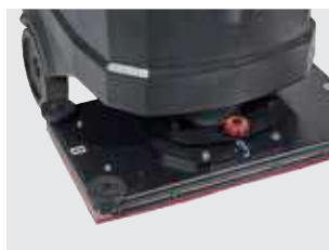
Lavadora orbital para a limpeza ou a decapagem de pavimentos (AS7190TO).