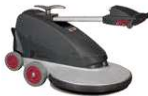
Pega dobrável para poupar espaço, fácil armazenamento e transporte da máquina.