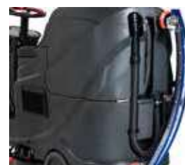
Suporte na parte traseira para colocar o bocal e desta forma passar em locais estreitos.