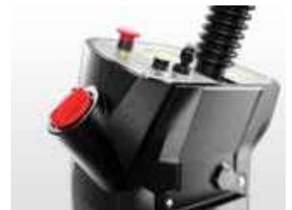
Remove a tampa vermelha e encha o depósito de solução com água