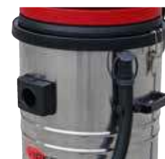
Mangueira de drenagem para fácil despejo do depósito.