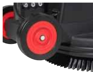
Rodas traseiras grandes que facilitam o transporte e asseguram uma boa manobrabilidade.