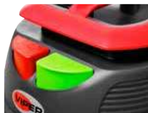
Botão ECO para ajustar a potência de aspiração e reduzir o ruído.