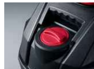
Fácil acesso frontal ao depósito de solução para recargas rápidas