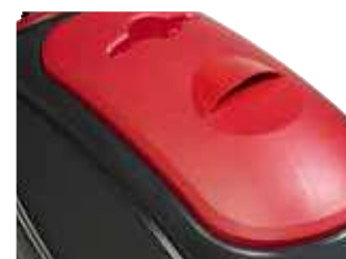
Limpeza simples do depósito de recuperação graças à grande abertura.