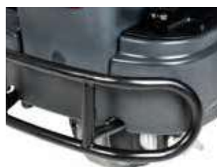
Pára-choques dianteiro de série que protege a máquina para uma maior vida útil.