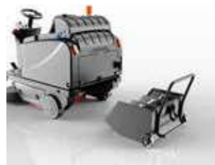
Depósito com rodas com mini depósitos opcionais