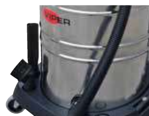
Fácil armazenamento dos acessórios.