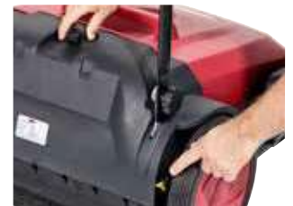
Escova principal ajustável.