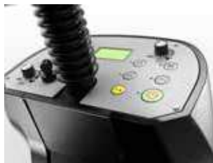
Um botão de start ativa as principais funções