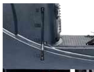
Indicador do nível de água visível no depósito.