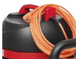
Suporte para cabo o que facilita o armazenamento.