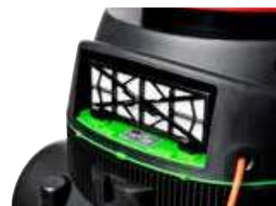
Filtro HEPA de série.