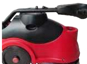
Pega dobrável para um fácil armazenamento.