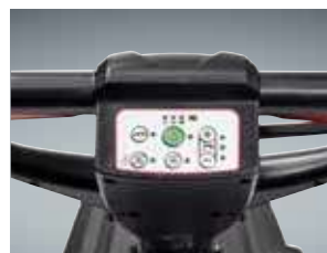
O painel de controlo intuitivo proporciona controlo sobre todas as funções (modelo AS4325)