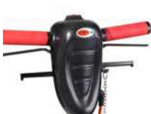
Pega ergonómica, ajustável em altura, botão central de segurança, manipulo para depósito de detergente.