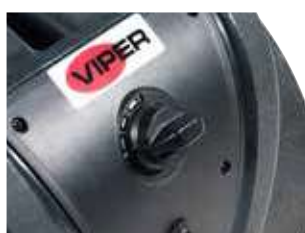
Motor de indução de 3 velocidades que permite poupar energia.