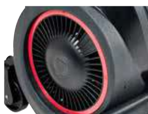
Ventilador de ar de alta qualidade com proteção do filtro.