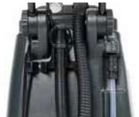
Mangueira de drenagem para facilitar o esvaziamento.