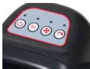
Painel de controlo fácil de usar com quatro funções principais.