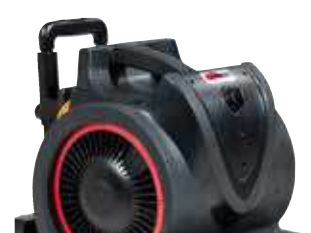
Pega para um fácil transporte.