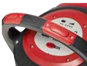
Botão de segurança integrado na pega. Cada botão pode ser acionado de forma independente.