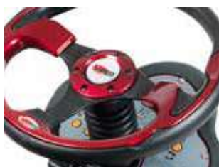
Painel intuitivo, botão táctil e menu fácil de usar.