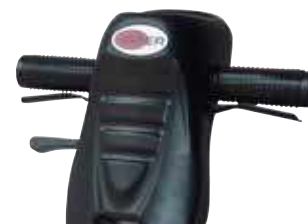
Controlos colocados ergonomicamente na pega.