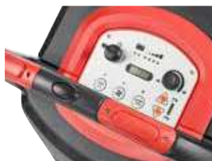
Painel de controlo intuitivo e com botões.